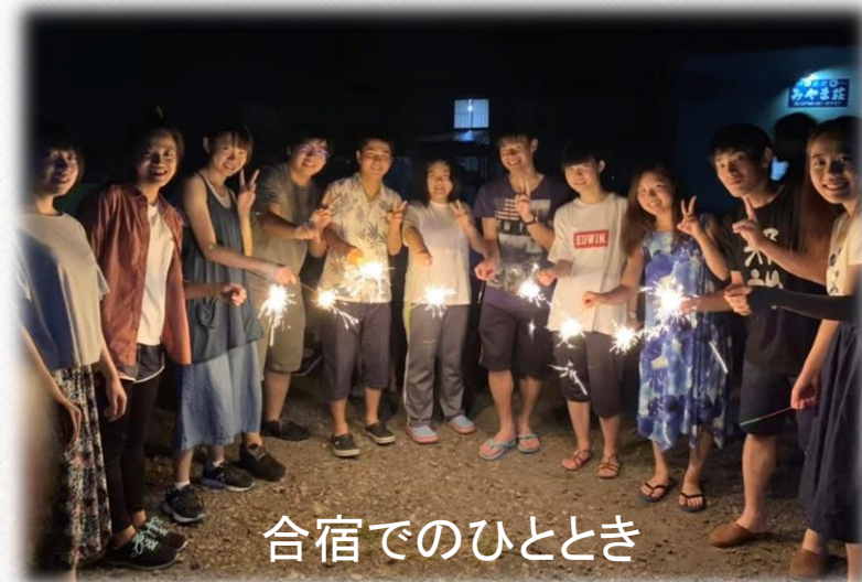
合宿でのひととき