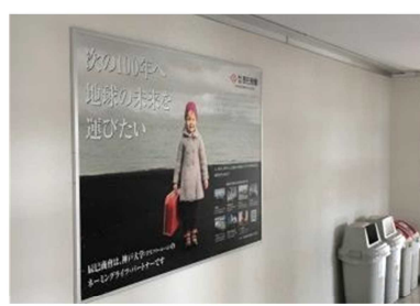
インフォメーションボード