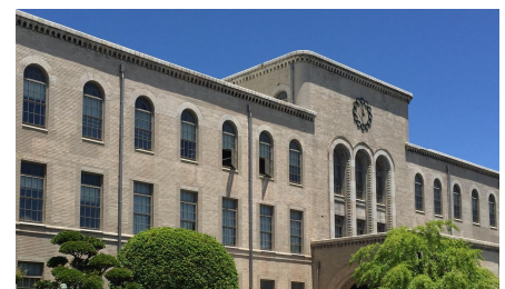
六甲台第1キャンパス(本館)