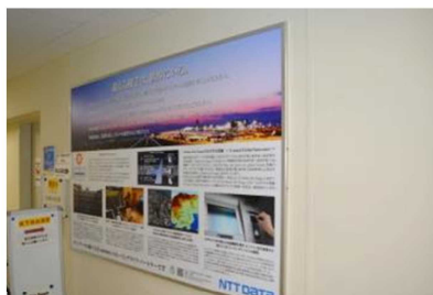
インフォメーションボード