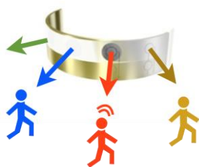
写真:有機人感センサ・フィルム